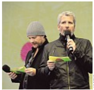
Stermann & Grisse moderierten „Into the City Open Air“

Die prominente Schar ließ es sich trotz strömenden Regens nicht nehmen, am