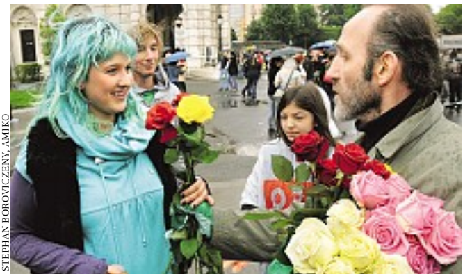
Schauspieler Karl Markovics verschenkte die Blumen an „Fremde“