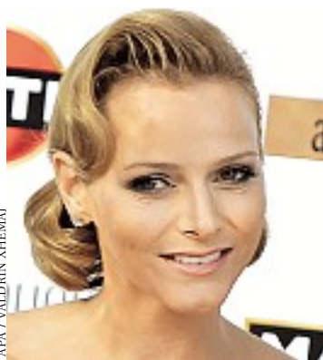
Ähnlichkeit: Charlene Wittstock

tion aus: „Rosen verschenkt man, wenn man jemanden mag oder liebt. Das sind die Blumen für ein schönes Miteinander“. Ein Wunsch an den Himmel an dieser Stelle: Es sollte öfters Rosen regnen.