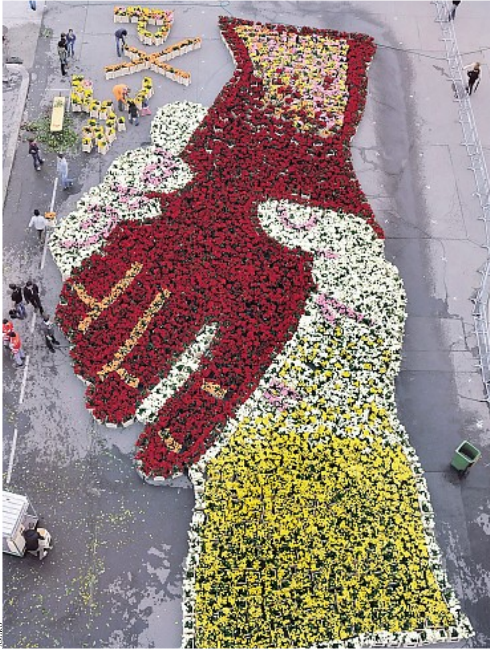
Fremde Hände schütteln: 100.000 Rosen wurden auf 2000 Quadratmetern für die Aktion installiert