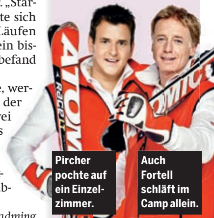
Pircher pöchte auf ein Einzelzimmer.

Während sich 14 der 16 Kandidaten im „Pichlmayrgut“ in Schladming eine Woche lang die Zimmer teilen, pochten zwei Promis auf mehr Privatsphäre: Volksmusikant Marc Pircher und Schauspieler Albert Fortell residieren nach eigenem Wunsch in Einzelzimmern. „Ich habe einen total leichten Schlaf, wache beim kleinsten Geräusch auf“, begründete Pircher auf Nachfrage den Sonderwunsch. Auch Fortell zog es vor, nach dem Gruppentraining allein zu schlafen.