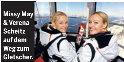
Missy May & Verena Scheitz auf dem Weg zum Gletscher.

Schladming/Planai. Ingwerwurzeln als „Bio-Doping“ (Goldi), Müsliriegel für die Nerven (Wimmer), heißer Tee gegen die Kälte (Russwurm): Ausgelassene Skikursstimmung gestern in Schladming, wo Armin Assingers 16 Promis – Vera Russwurm, Toni Polster, Andi Goldberger, Oliver Wimmer, Diana Lueger, Christian Clerici, Albert Fortell, Bernie Rieder, Leo Hillinger, Missy May, Marc Pircher, Verena Scheitz, Petra Frey, Onka Takats, Heidi Krings und Elke Lichteneg-