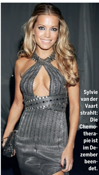
Sylvie van der Vaart strahlt: Die Chemotherapie ist im Dezember beendet.